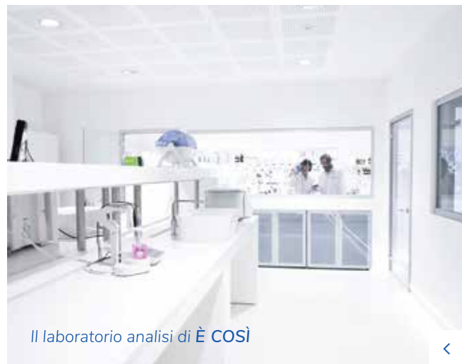
Il laboratorio analisi di È COSÌ