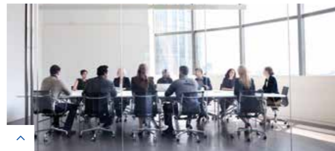
Il Centro Studi Soligena organizza convegni e workshop di approfondimento e formazione sul tema del Cleaning.